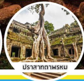
ปราสาทตาพรหม