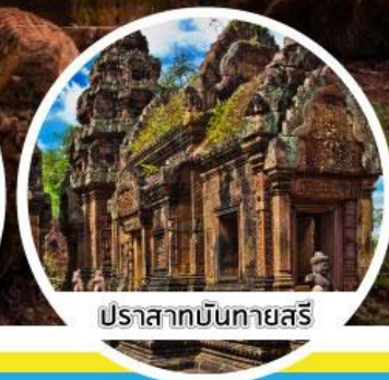
ปราสาทบันทายสี